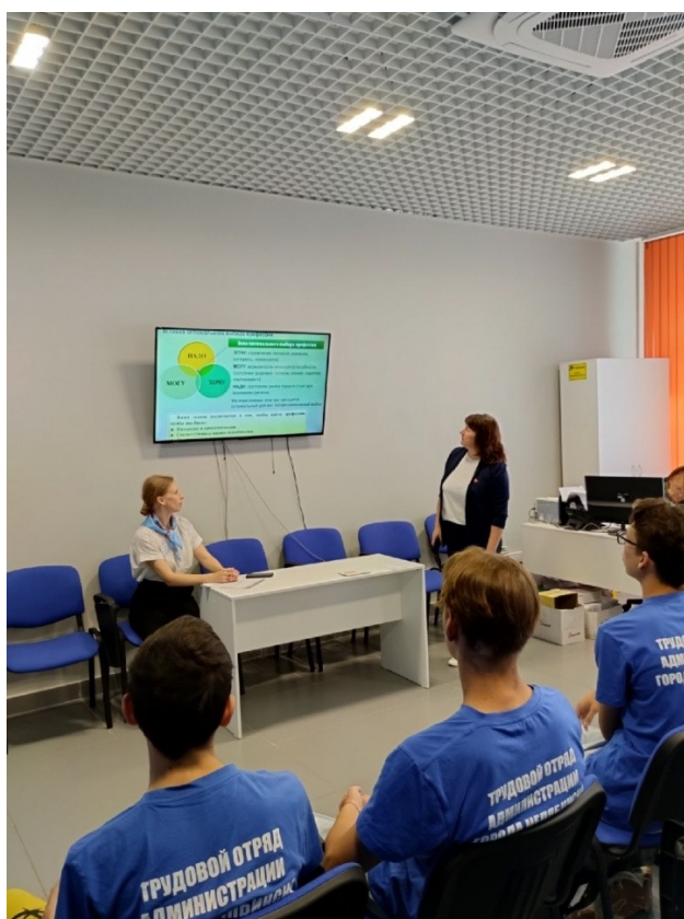
Экскурсия в Центр занятости населения», отдел по Ленинскому району