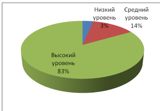
Рис. 6. Диаграмма уровней по показателю – проявление умения сотрудничать, действовать в коллективе

7. Показатель – развиты навыки общения и публичного выступления, навыки грамотной письменной и устной речи, развито умение аргументировано и доходчиво донести свою мысль до аудитории детей, сверстников, взрослых.