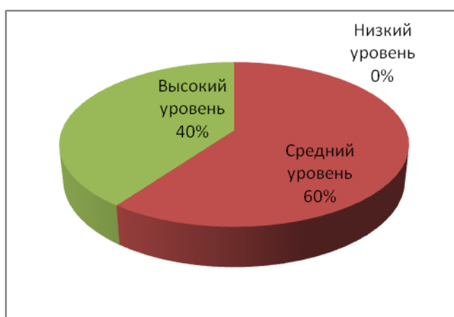
Рис. 7. Диаграмма уровней по показателю – развиты навыки общения и публичного выступления, навыки грамотной письменной и устной речи, развито умение аргументировано и доходчиво донести свою мысль до аудитории детей, сверстников, взрослых

7. Показатель – развиты навыки общения и публичного выступления, навыки грамотной письменной и устной речи, развито умение аргументировано и доходчиво донести свою мысль до аудитории детей, сверстников, взрослых.