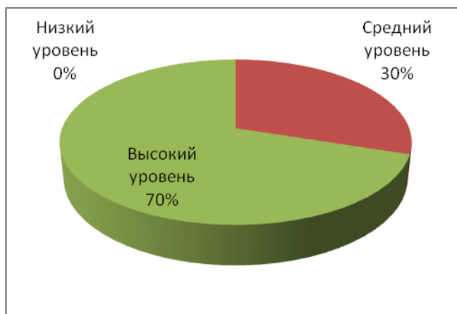
Рис. 4. Диаграмма уровней по показателю – проявление ценностного отношения к окружающей среде, природе

4. Показатель – проявление ценностного отношения к окружающей среде, природе.