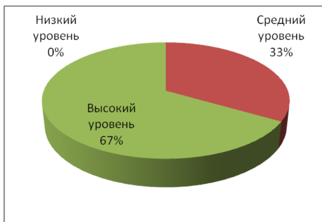
Рис. 1. Диаграмма уровней по показателю – развиты навыки трудовой деятельности

2. Показатель – проявление умения самостоятельно собрать и заполнить документы, необходимые при поступлении на работу.