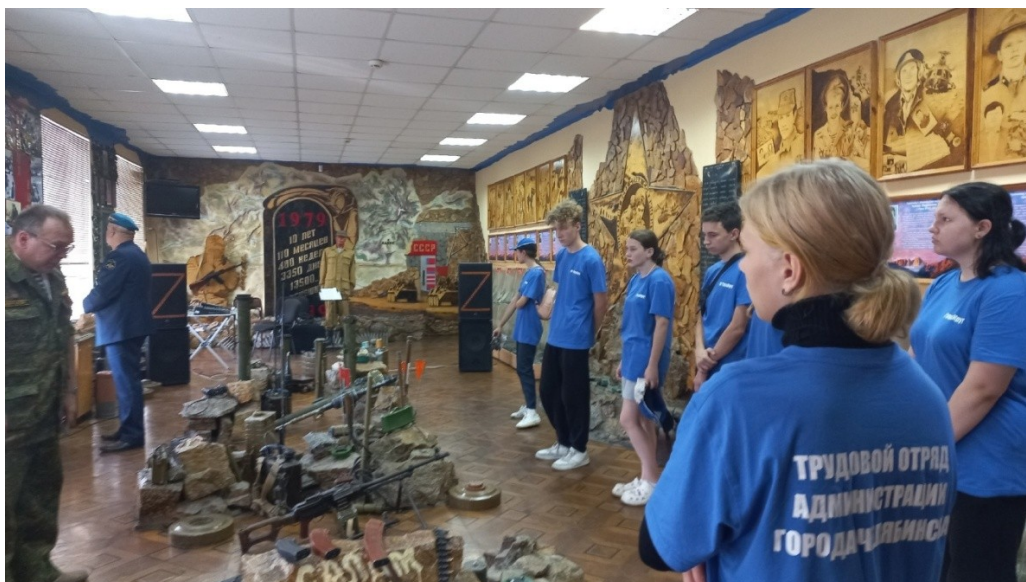
Экскурсия в Музей памяти воинов-интернационалистов