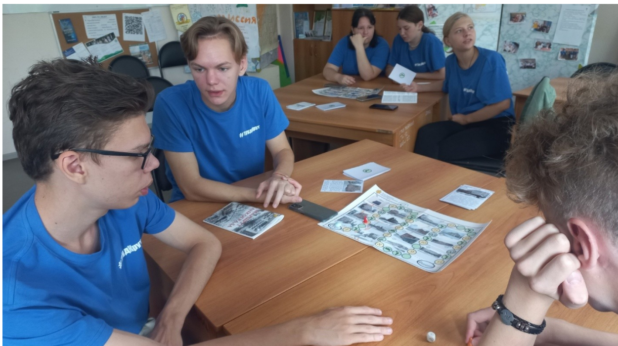
Тематическая программа «По маршруту Танкограда»