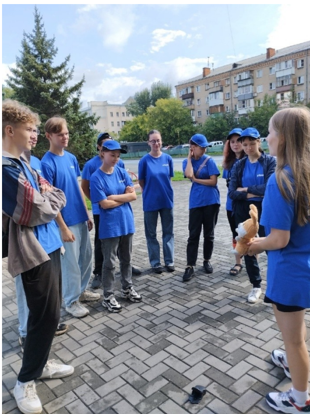
Проведение тематической программой «Здоровая Россия – Общее дело» в МБОУ «СОШ № 75 г. Челябинска»