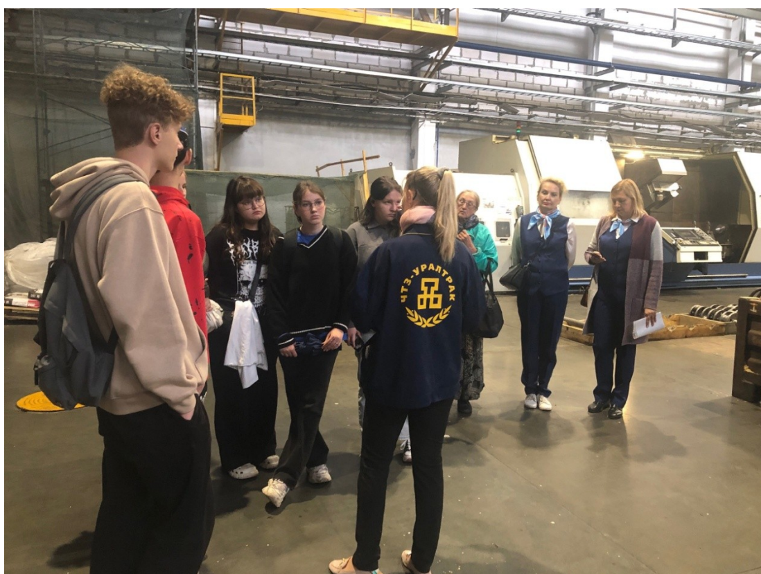
Экскурсия в Челябинский тракторный завод