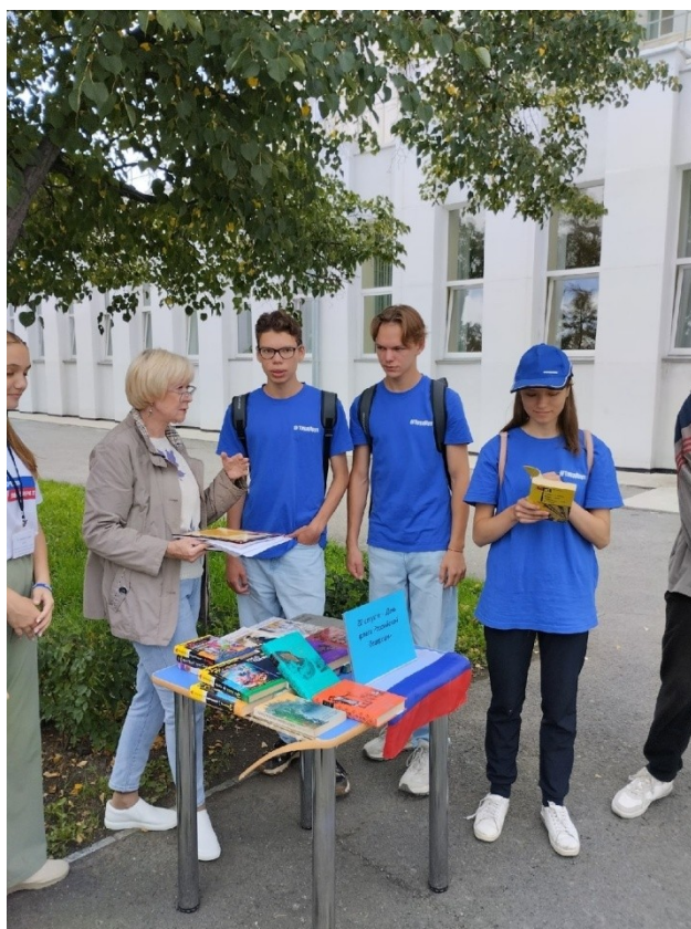
Участие в игровой программе, посвящённой Дню Российского флага