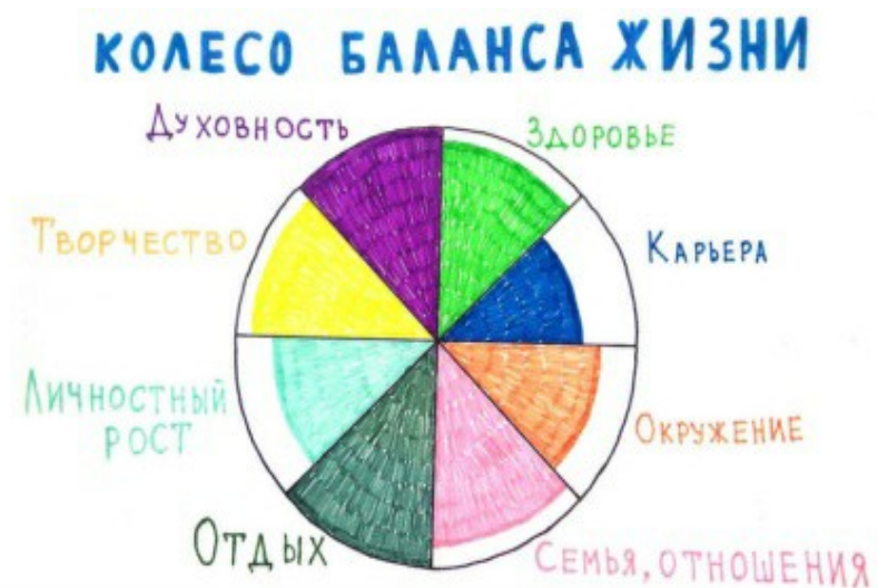
Рис. 1. Колесо жизненного баланса