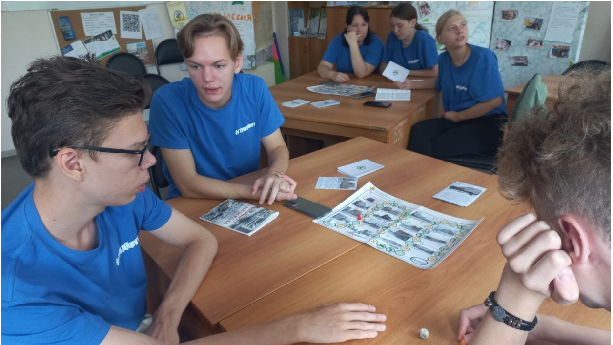
Тематическая программа «По маршруту Танкограда»