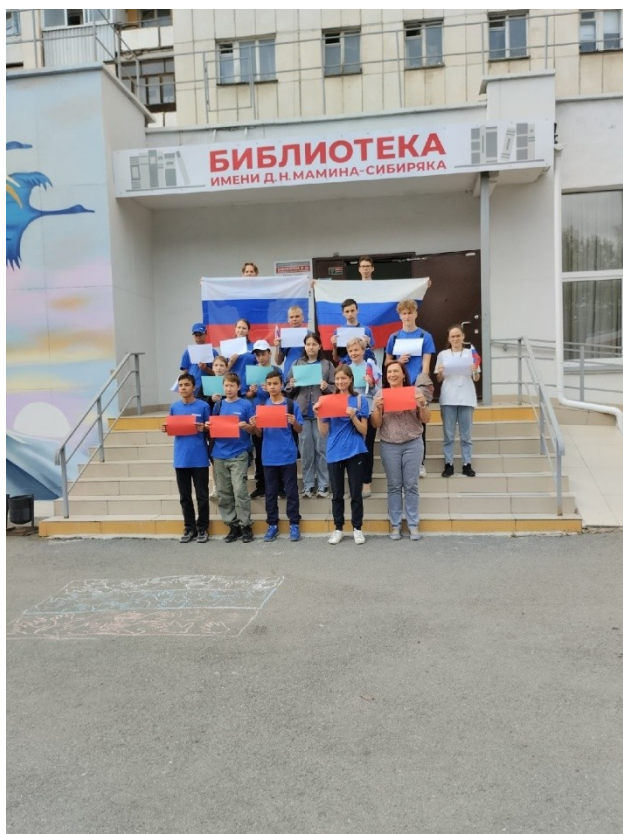
Участие в игровой программе, посвящённой Дню Российского флага