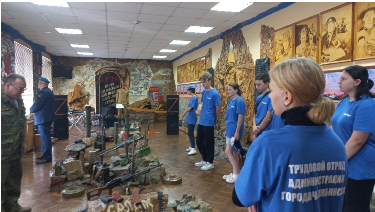
Экскурсия в Музей памяти воинов-интернационалистов