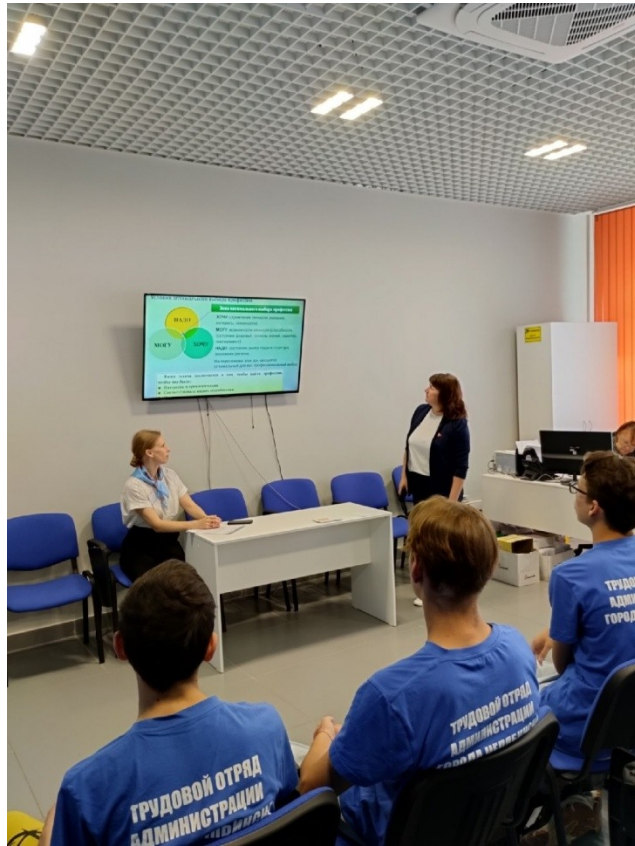
Экскурсия в Центр занятости населения», отдел по Ленинскому району