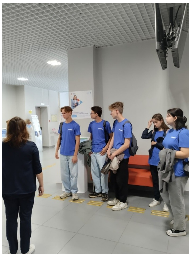
Экскурсия в «Центр занятости населения», отдел по Ленинскому району