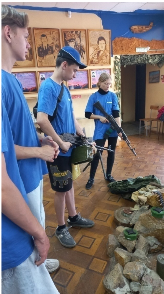
Экскурсия в Музей памяти воинов-интернационалистов