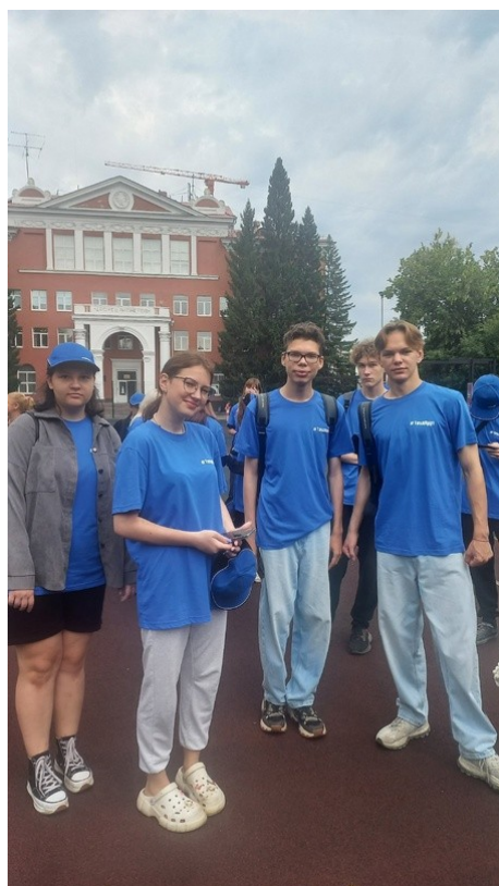
Торжественная церемония открытия трудовой смены