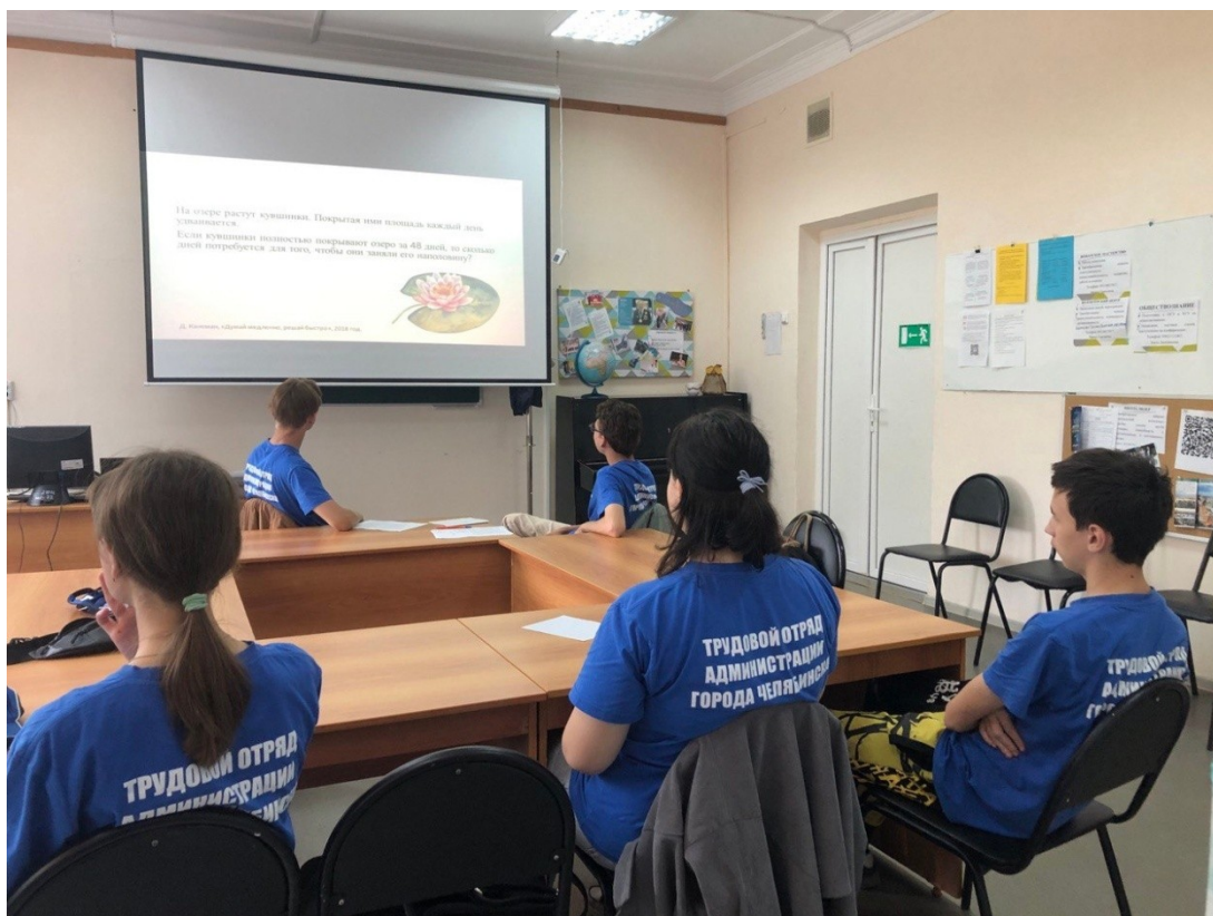
Тематическая программа «Думай медленно, решай быстро»