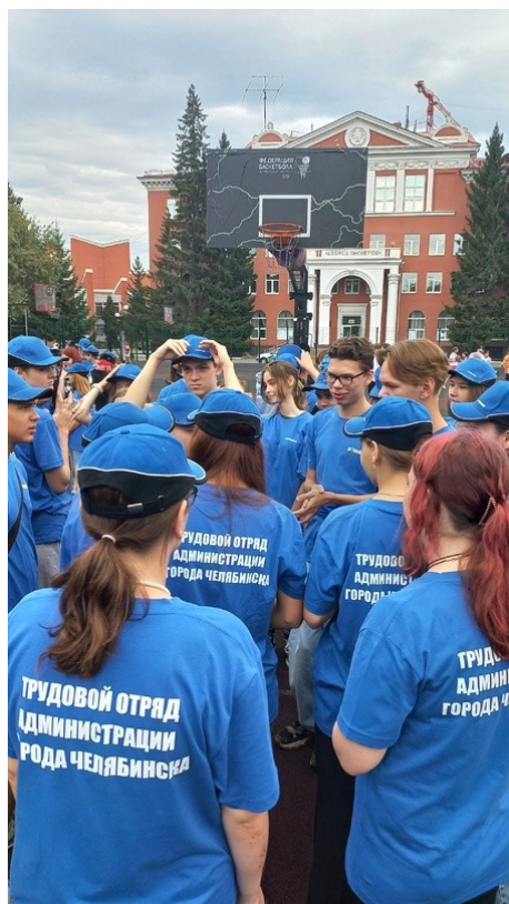
Торжественная церемония открытия трудовой смены