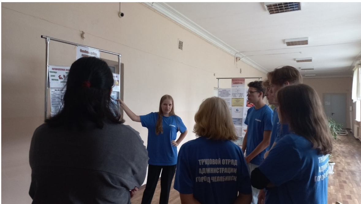
Знакомство с тематической программой «Здоровая Россия – Общее дело»