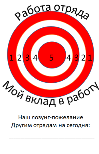
Рис. 1. Бланк ежедневного анализа деятельности

Каждый день в трудовом лагере подводятся итоги, составляются планы. Обучающиеся оценивают свой вклад (отмечают на мишени), говорят пожелания своему отряду и отрядам города.