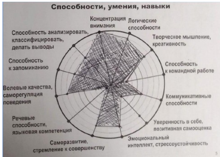
Рис. 3. Колесо способностей, умений и навыков