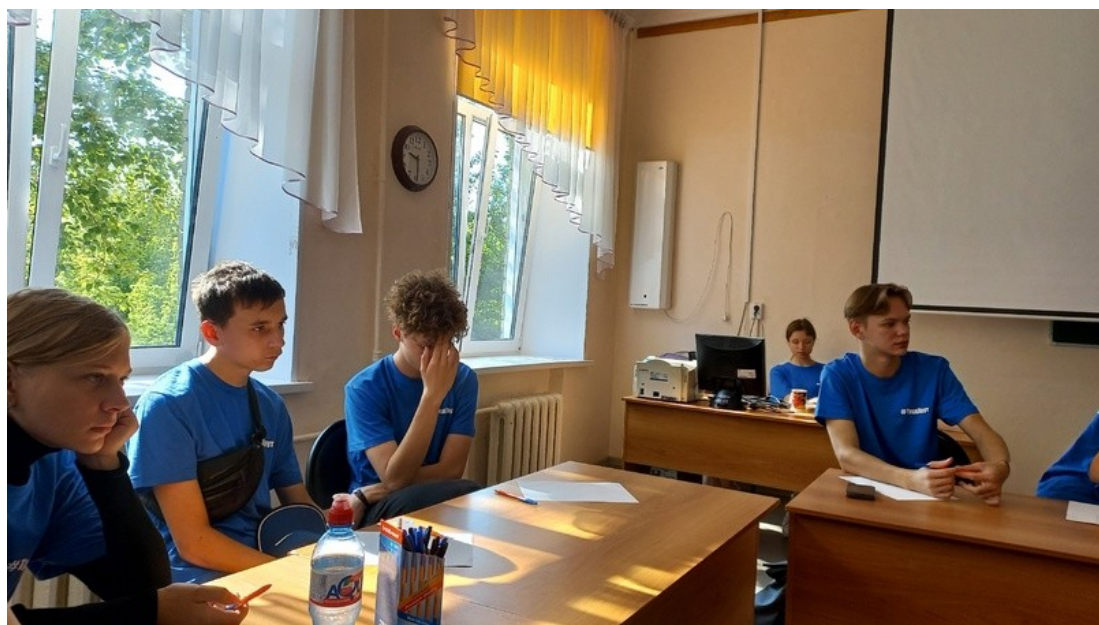
Рефлексия. Подведение итогов