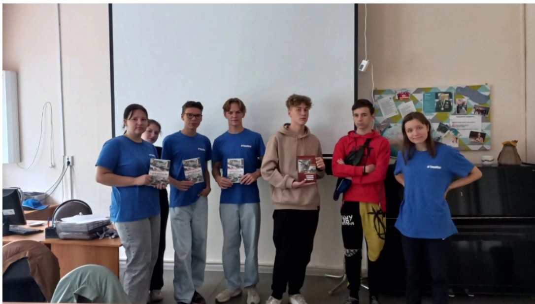
Занятие по теме «История Танкограда»