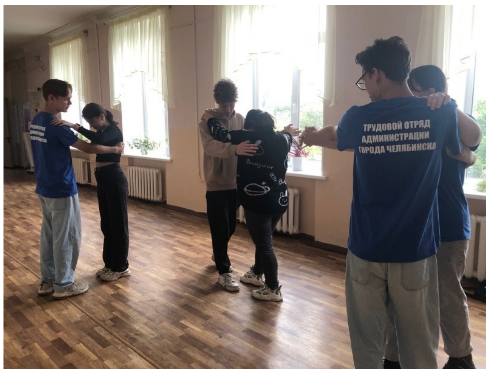
Мастер-класс по танцам «Обучение классическому танцу «Вальс»