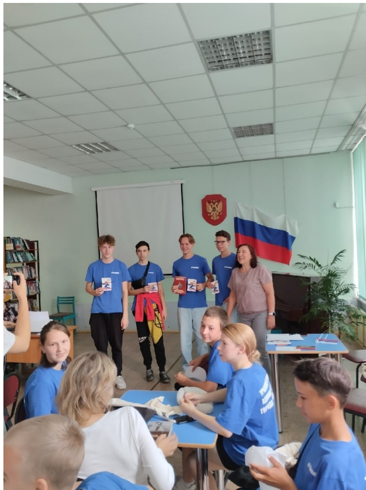
Участие в игровой программе, посвящённой Дню Российского флага