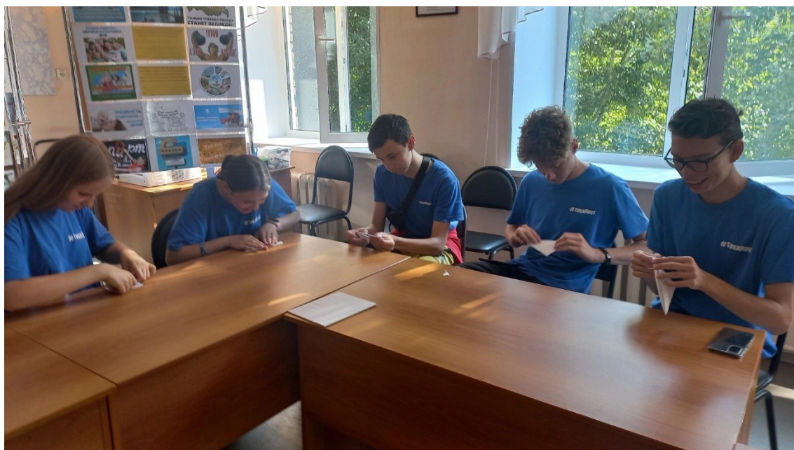
Мастер-класс по оригами