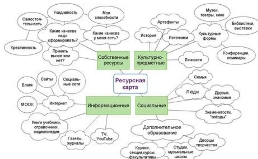
Рис. 2. Ресурсная карта