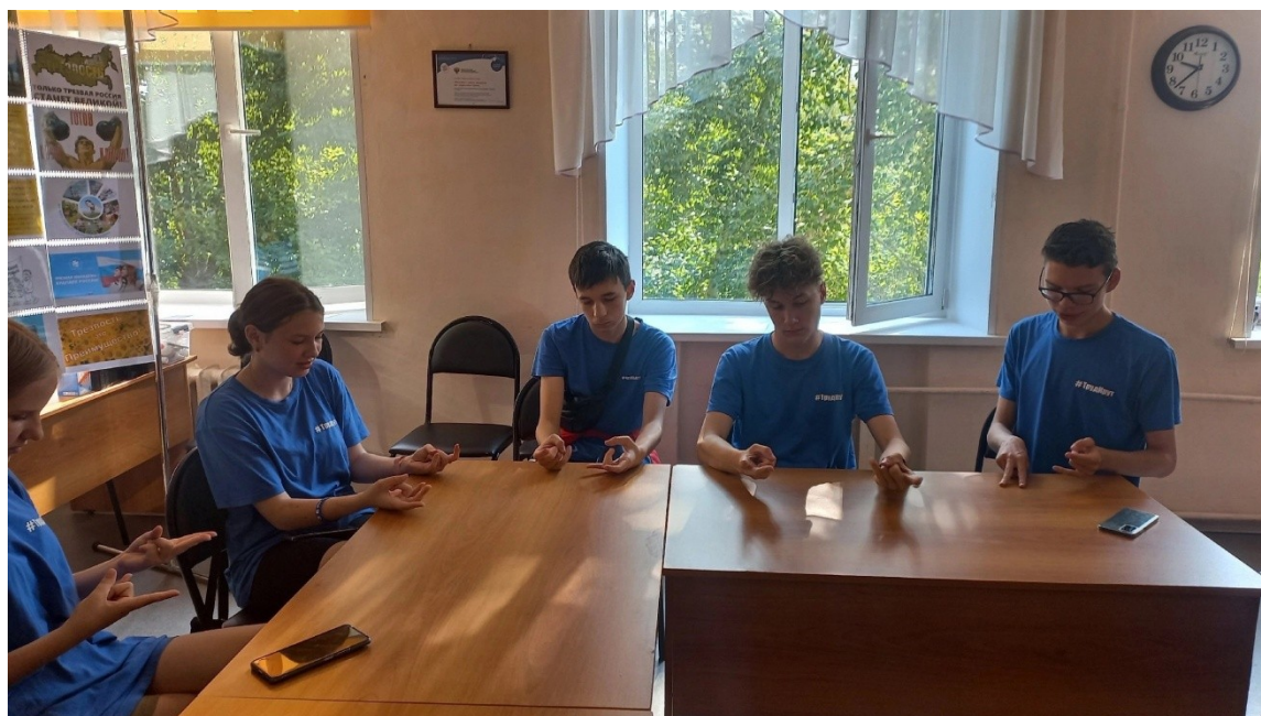
Мастер-класс по нейрогимнастике