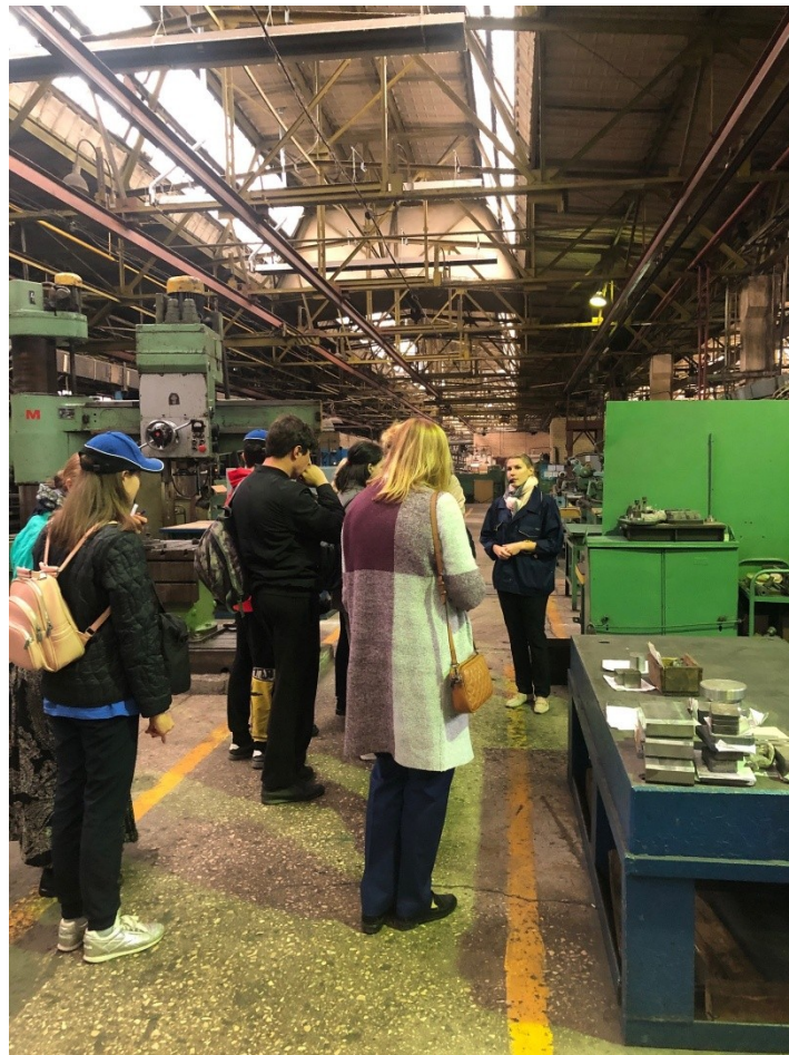
Экскурсия в Челябинский тракторный завод