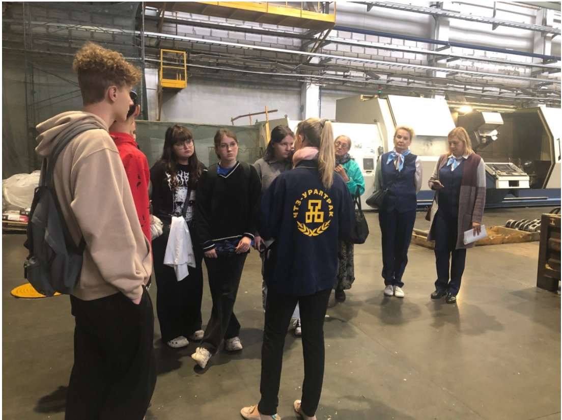
Экскурсия в Челябинский тракторный завод