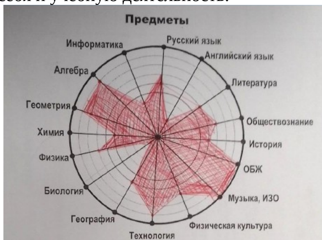
Рис. 2. Колесо учебы

Колесо учебы и способностей, умений и навыков позволяет проанализировать себя и учебную деятельность.